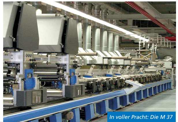
In voller Pracht: Die M 37

Stufenlose Getriebetechnik gewährleistet eine passgenaue Produktion in höchster Qualität. Schnellspannsysteme, Presetting und ein speziell geschultes Team ermöglichen kürzeste Rüst- und Wechselzeiten . Somit werden die Marktanforderungen auch bei Sortenvielfalt und immer kleineren Druckauflagen gänzlich erfüllt. Die gegen mechanische und chemische Einwirkungen besonders empfindliche Heißfolienprägung wird durch Reversetiefdruck ersetzt.