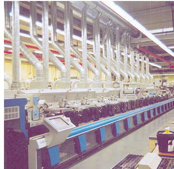
Modernisierung des Maschinenparks