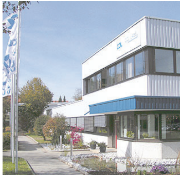
Umgestaltung des Werksgeländes

Investition in umfangreiche Projekte 2007